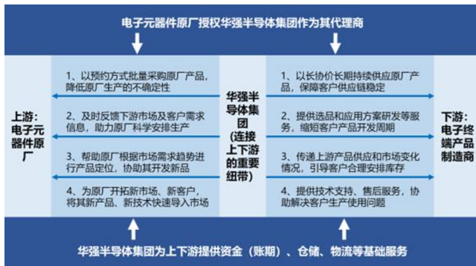
（华强半导体集团在产业链中的作用示意图）

华强半导体集团作为专业的大型电子元器件授权分销商，充分发挥大平台优势，以多年沉淀的产品分销管理能力、产品技术能力、市场研究能力、资金实力等和积累的行业经验，为合作的原厂、客户提供有价值、可信赖的服务：一方面，帮助上游原厂根据市场需求趋势进行产品定位，并为客户提供产品应用方案研发、设计服务，缩短客户产品开发周期的同时，将原厂的新产品、新技术快速导入市场；另一方面，通过在长期、持续的交易中及时捕捉产业供需动向和趋势，做出前瞻性的预判，助力上游原厂科学安排生产，引导下游客户对采购、库存等进行合理安排、精准备货，结合电子元器件分销自带的“蓄水池”功能，平滑供应链上下游冲击，长久、有效地保障客户供应链和生产的安全和稳定。