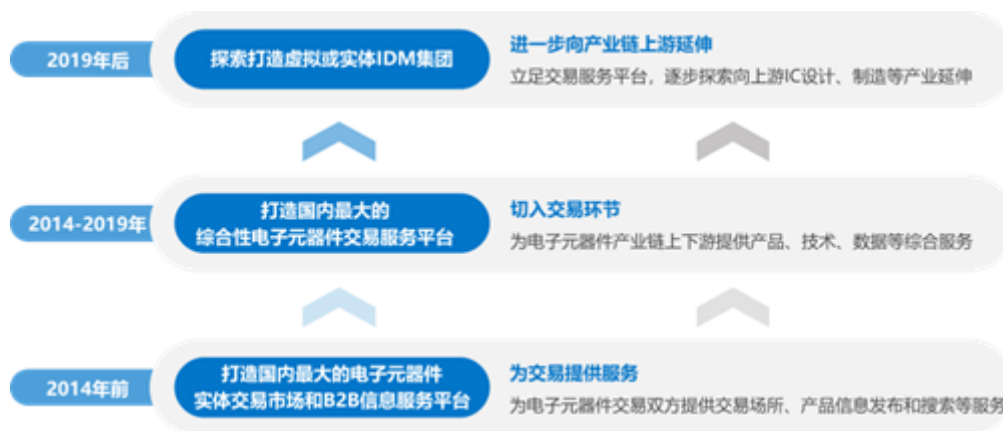
深圳华强战略演进示意图

公司自成立以来，长期深耕电子行业，基于产业发展客观规律，结合公司自身资源禀赋制定并持续优化可持续发展战略，通过多维度的、累进式的创新实践，不断完善、延展公司的产业体系，逐步提升公司的产业价值。自 2014 年底战略转型切入电子元器件交易环节以来，公司围绕发展战略迅速做大做强，在转型后 7 年时间即实现了营收 10 倍增长，印证了公司发展战略的科学。