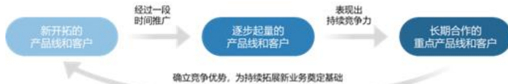
(产品线和客户结构持续优化示意图)

① 对于长期合作的重点产品线和客户，继续稳固、深化合作关系： 面对报告期内电子元器件行业景气度的下行调整，华强半导体集团重点做好上下游长期合作伙伴的服务工作，加大沟通频率，及时掌握和传递行业供需信息，助力上下游更好地安排生产；并在持续的服务和沟通中积极挖掘各种可能的合作机会（包括新品类、新项目的合作机会或提升合作份额的机会，扩大产品线代理权范围或向下游客户导入更多产品线的机会等 [注] ），进一步拓宽合作的深度和广度，为在行业景气度回暖后业务进一步发展蓄势。